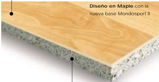
Diseño en Maple con la nueva base Mondosport II

Fácil mantenimiento y resistente a manchas de comida y bebidas.